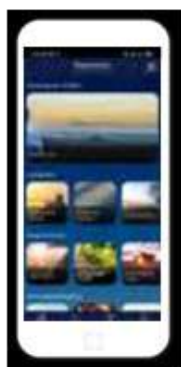
media library (медіатека)